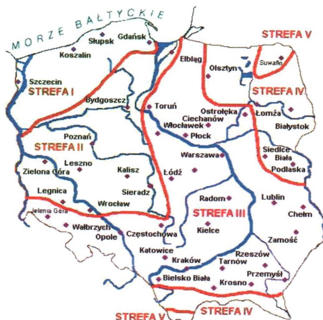
Rys. 1 Strefy klimatyczne Polski i temperatury obliczeniowe

Położenie obiektu, w którym planowany jest montaż, na mapie ma wpływ na pracę instalacji. W zależności od współrzędnych geograficznych rozbieżności w temperaturach projektowych mogą mieć znaczącą wartość. W skali kraju ilustruje to poniższa mapa (Rys.1).